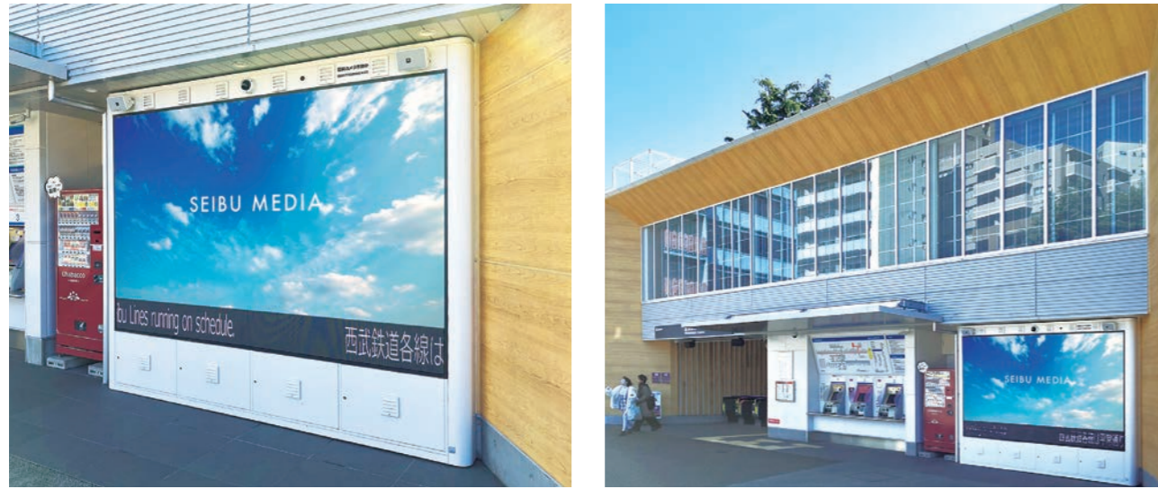
※画面の下辺には、西武線運行情報(運行平常時はその旨を表示)等が表示されます。