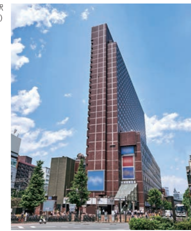
西武新宿駅 (新宿プリンスホテル)