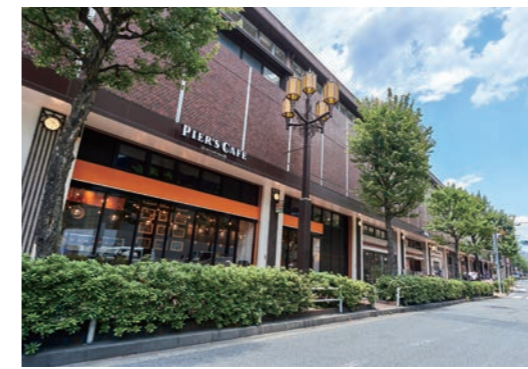
西武新宿駅高架下の商業施設「Brick St.」