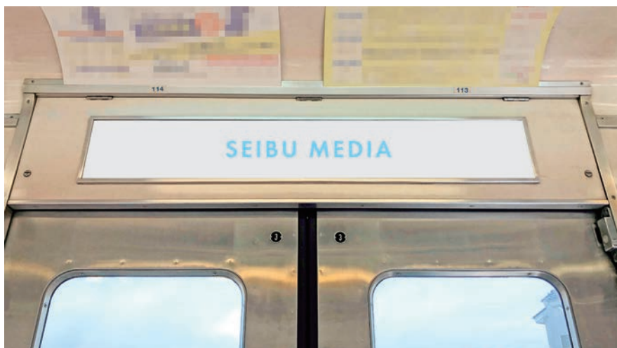
■ 媒体サイズ (単位:mm)