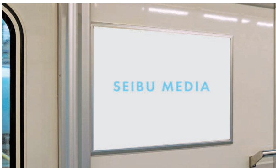
■ 媒体サイズ (単位:mm)